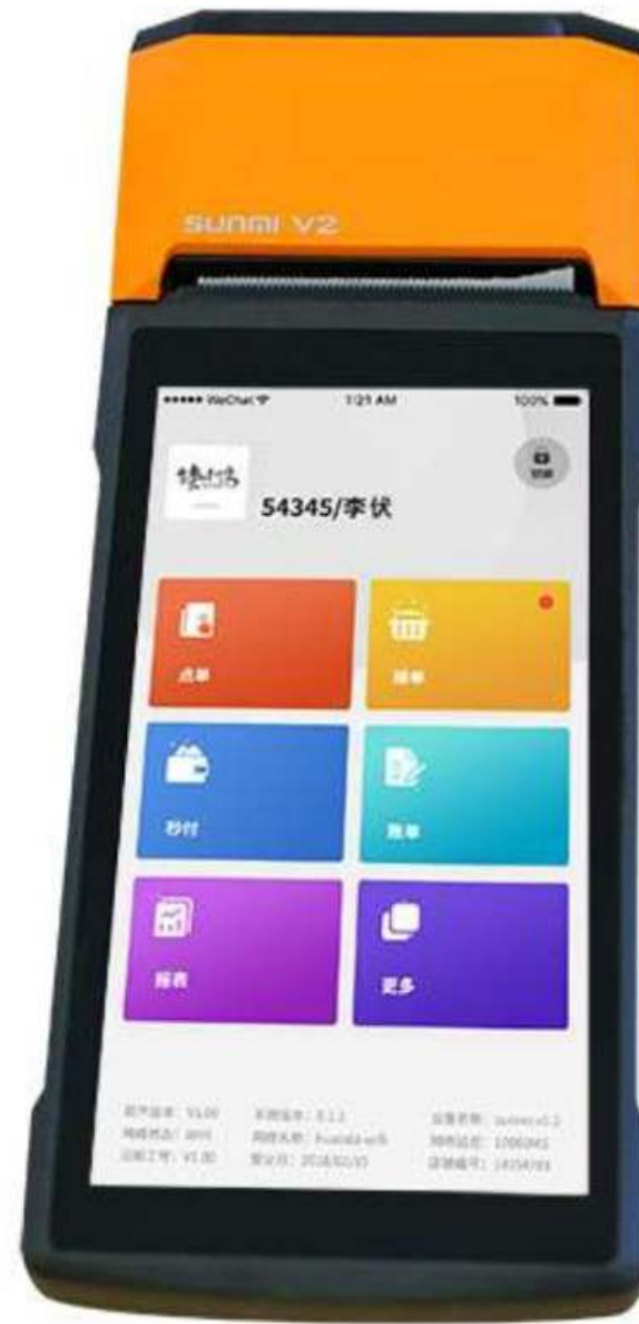
云店POS Android 手机版